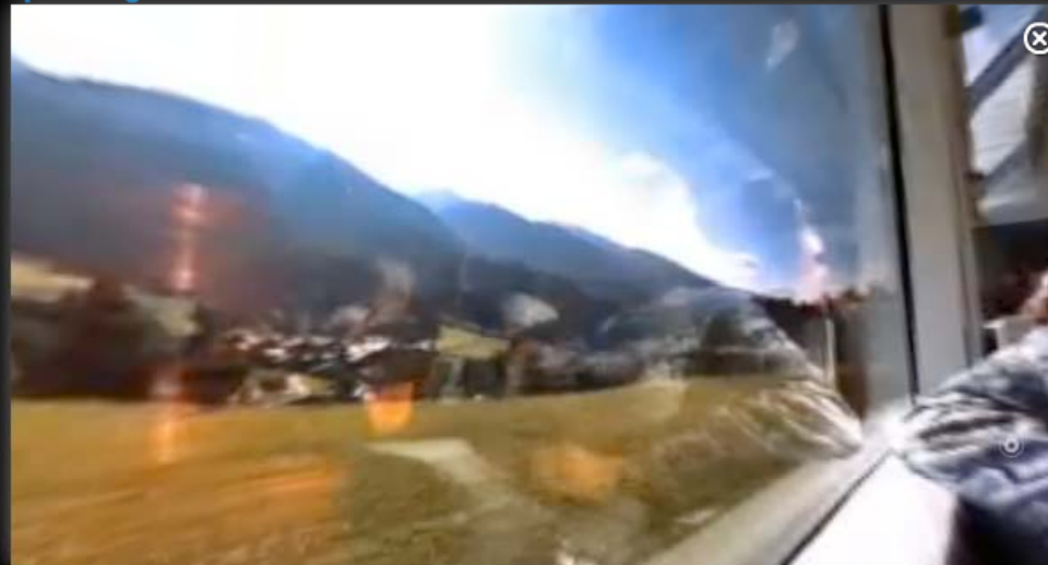
Glacier Express Fiesch - Goms

Sie befinden sich hier: ▶ Reiseplanung ▶ Öffentlicher Verkehr